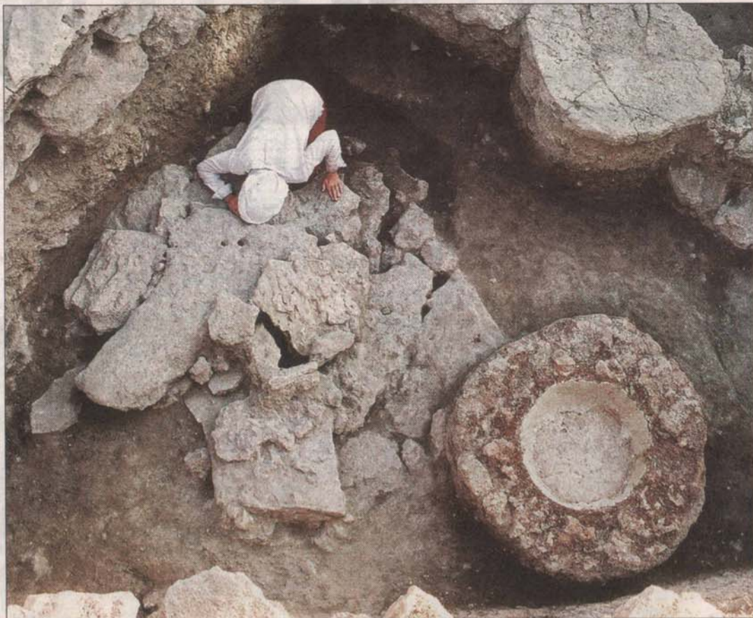
De bovenzijde van het graf in het centrale deel van Tell Tweini. Rechts het bassin, linksboven bestudeert een archeoloog de boorgaten waarlangs het water in het graf werd gegoten.

De archeologen hopen in de toekomst nog meer te weten te komen over de geschiedenis van deze intrigerende stad. Zo lijkt de plaats ontsnapt te zijn aan verwoestingen die de geheimzinnige 'Zeevolkeren' in de regio aanrichtten. Bekende steden zoals het nabijgelegen Ugarit werden rond 1200 voor Christus platgebrand en verlaten. Maar Gibala bleef blijkbaar gespaard en bleef continu bewoond: vrijwel een unicum voor de Syrisch-Libanese kust.